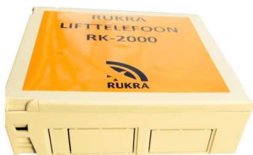
Kunststoffgehäuse (RK-2015) OPTION